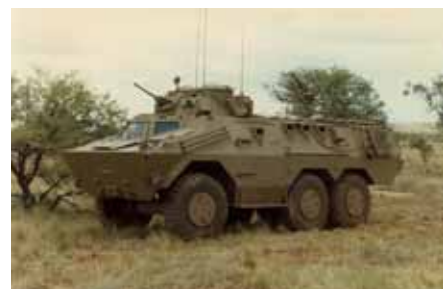
ファミリー化されたカラーテル装甲車

アームスコーは徹底して合理的な生産システム構築を試み、それに成功したといえよう。効率的な装備開発の例を挙げれば例えば、南ア陸軍は中型から大型まで全てのクラスの部品を共有化したSAMIL(サウス・アフリカ・ミリタリー)トラック・ファミリーを採用、これにともないそれまで使用していた軍用トラック、ウニモグが不要となったのでその駆動系を利用して、耐地雷装甲車マンバが開発生産された。また、1970年代に南ア機械化部隊の主カラーテル6X6装甲車ファミリーは20ミリ機関砲に搭載したICVをベースモデルに、指揮通信型、60ミリ迫撃砲搭載型、80ミリ迫撃砲搭載型、90ミリ砲を搭載した火力支援型、スイフト対戦車ミサイル搭載型、8x8の兵站型(これは試作のみ)など殆ど全てをカラーテル・ファミリーでまとめ、兵站の負担を大幅に軽減した。