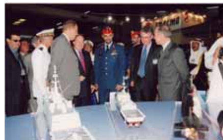
アフガニスタンで開催される見本市 IDEX

防衛庁、自衛隊の各幕僚部ではこのような機会を有効に利用していないために、国際的な常識からは無理難題と思えるような非常識な要求を日常的にメーカーや商社に要求している。それが商社の手数料やメーカーの生産コストを高い水準に留めている元凶の一つである。