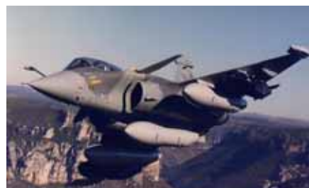
ダッソー社のラファール戦闘機