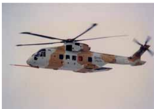
海自が採用したアグスタ・ウエストランド EH-101

自衛隊創設以来初の欧州製作戦用航空機となったアグスタ・ウエストランドの EH 101 を採用したのは米国に偏る我が国の装備調達にインパクトを与えたが、僅か14機の調達数である