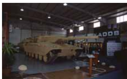
ファルコンII無人砲塔を搭載したチャレンジャー1戦車

合併会社の例としては英国の特殊車両メーカー、ジャッカル社、南アの装甲車両設計会社、メカノロジー社とケーブでヨルダン国内に合併企業を設立している。ケーブは、戦車の近代化、戦術 UAV、拳銃、航空機、各種軍用車両、特殊部隊用装備など