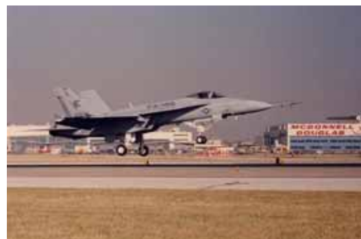
F/A-18スーパーホーネット

会社の中で技術者などの専門職が社員の48パーセントを占めている。ソ連崩壊後、スイスは軍を縮小しており、国内だけでは売り上げが成り立たない。外国から兵器を導入する場合でも、極力ラーグ社が国産化する方向である。ドイツから導入したレオパルド2戦車にしても、