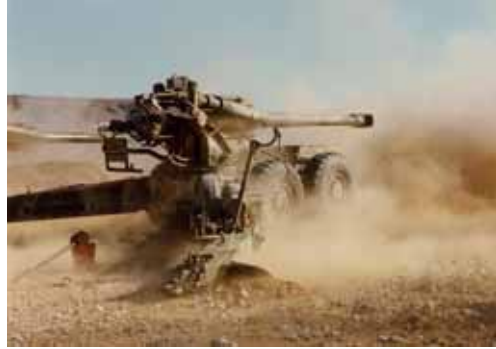
ベースブリードにより39キロより長射程を実現したG5榴弾砲

また優れた研究者をスカウトするという、ことも行われた。火炮の権威であるカナダ人、バル博士(イラクのスーパーガンの開発者)をスカウトして、1983年に世界に先駆けてロケット・アシストを使用せずに射程を大幅に延長できるベース・ブリード弾、モジュラー型の装薬を使用する最大射程39キロの長射程155