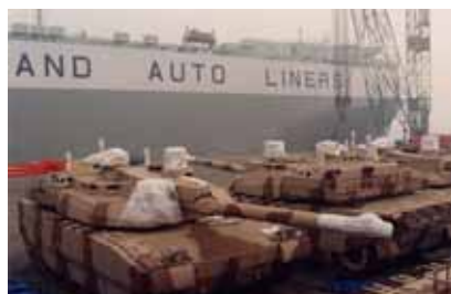
UAEに輸出されるKrauss-Roßford社のレオパルド戦車

宙企業 EADS（欧州航空防衛宇宙会社）が同社を買収するともいわれており、実現すればボーイング