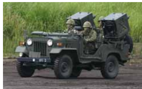
六四式MAT。六四甲は採用された兵器勃発の現役である

さらに輸入やライセンス生産される兵器も他国に比較して非常に割高である。これはユーザーたる防衛庁・自衛隊が諸外国の軍隊と全く異なる、内閣府に属する一行政機関であるため直接的に他国の軍隊と比較されにくく、このため「世界の常識」を無視できたことが大きい。具体的には以下のような問題点が指摘できる。