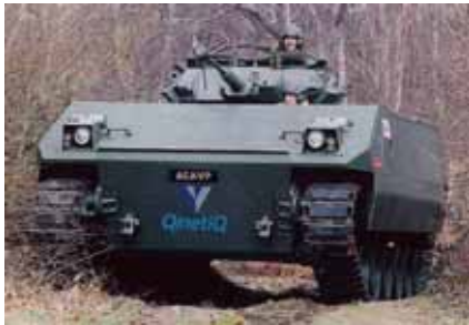
タツパウェア戦車とACAVP

98年、英国政府は MoD(国防省)の PPP 手法による民営化の方向を示し、このため国防省の研究機関である DERA ( 防衛研究評価庁、Defence Evaluation and Research Agency ) から核関連など一部のセンシティブな研究を除き、キネティックとして2001年に分離。会社組織となる。国防省に残った部門は Dstl ( 防衛科学技術研究所、Defence Science and Technology Laboratory ) となり、約3千人が残った。Dstl は核や外国との仕事などセンシティブな案件を担当している。2002年に MoD はキネティックと民間企業であるカーライル・グループの提携を認めた。本年同社は完全民営化を果たしたが、政府は同社の黄金株を保有し、影響力を維持している。