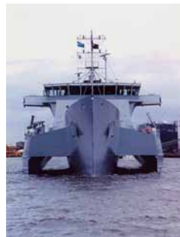
トリマラン(三胴実証船)

社長、CEO は民間人で、役員会は上記の2人のほか、6名であり、社員の最年長は70歳、最年少は37歳である。